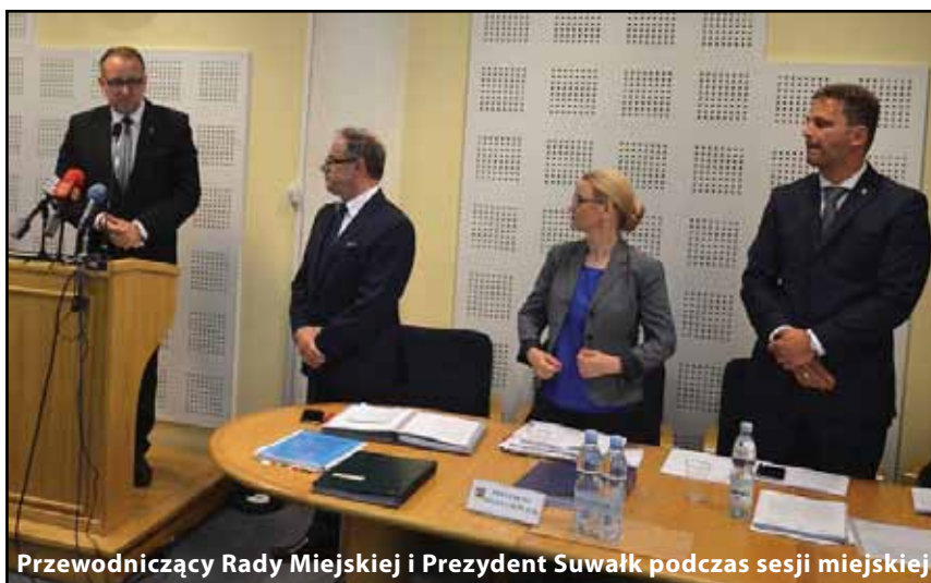
Przewodniczący Rady Miejskiej i Prezydent Suwałk podczas sesji miejskiej.